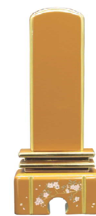
ライトブラウン 総高 17.5cm