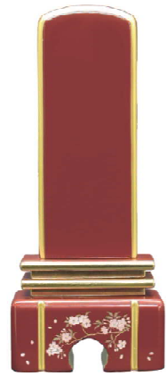
ワインレッド 総高 17.5cm