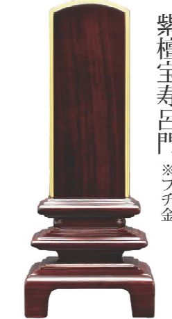
紫檀宝寿呂門 ※フチ金