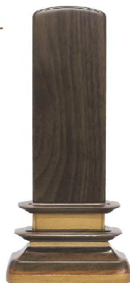
寸法・総高 3.5号 15.5cm 4.0号 17.0cm 4.5号 19.0cm