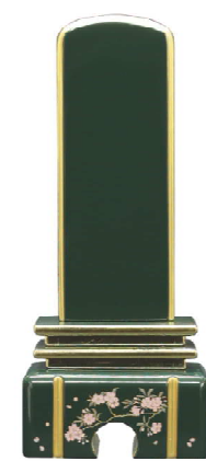
ダークグリーン 総高 17.5cm