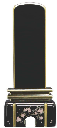
ブラック 総高 17.5cm