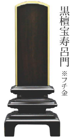
黒檀宝寿呂門 ※フチ金